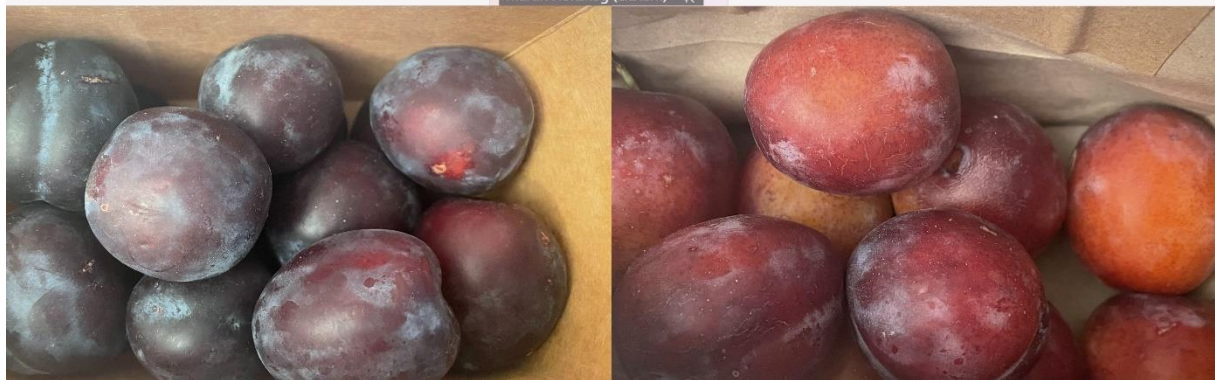
Bilde: fra møte med fruktpakkeriene 3. september.